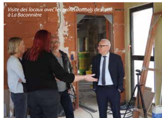
Visite des locaux avec les professionnels de santé à La Baconnière

La construction de ces deux Maisons de Santé a permis de faciliter l'installation de nouveaux professionnels de santé sur notre territoire et notamment 3 nouveaux médecins généralistes.