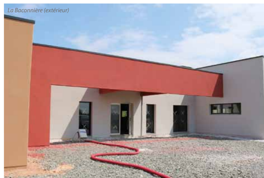
La Baconnière (extérieur)

D'une surface de 350 m 2 et située à proximité de la l'Espace François LEGRAND, la Maison de Santé de La Baconnière accueillera les professions suivantes : médecins généralistes, kinésithérapeutes, infirmière libérale, ergothérapeute et psychologue.