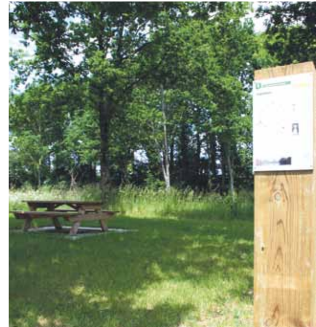
Départ du Circuit de La Gare à St Denis de Gastines

Les 200 km de sentiers de randonnées de l'Ernée sont reconnus pour leur grande qualité et font le bonheur des promeneurs, touristes ou clubs de randonneurs du secteur. En plus de l'entretien réalisé 2 fois par an et du balisage régulier, en lien avec l'association Ernée Randonnée Pédestre, la Communauté a choisi depuis de nombreuses années de mettre en valeur cet atout.