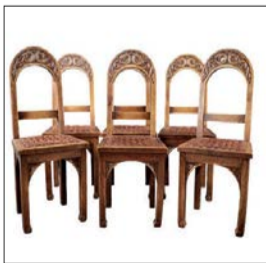
Suite de 6 chaises en chêne par JACQUES PHILIPPE, rare travail du mouvement SEIZ BREUR